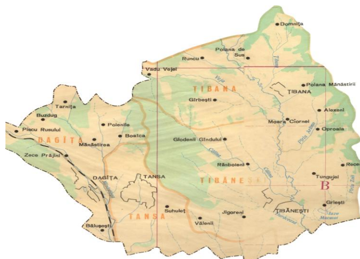
Harta fizică a microzonei Țibănești, județul Iași

Caracteristicile sociale și economice ale zonei studiate au fost evidențiate printr-un sistem de indicatori care au făcut posibilă conturarea imaginii privind resursele umane, activitatea agricolă și potențialul industrial. Principalii indicatori analizați se referă la următoarele aspecte: